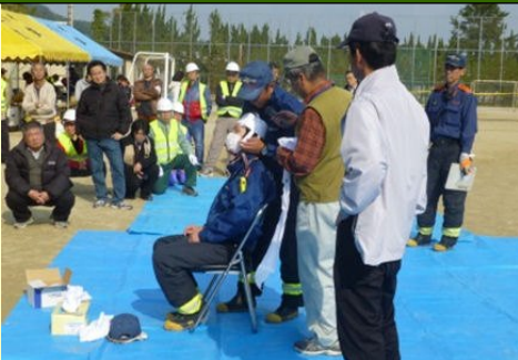
三角巾による応急処置