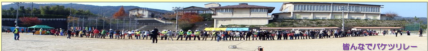
みんなバケツリレー