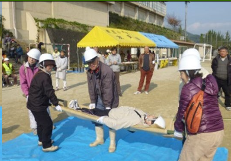
簡易担架組立て訓練