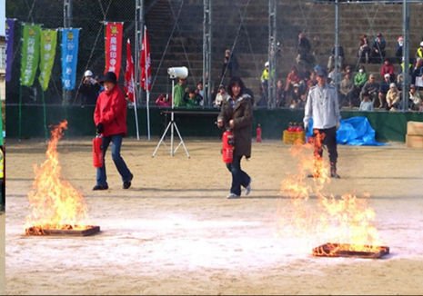
有志による消火器体験