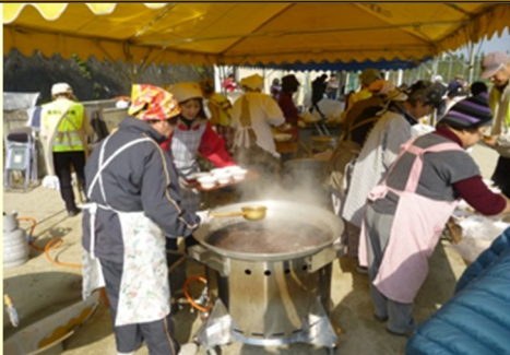
「ぜんざい」の炊き出し訓練