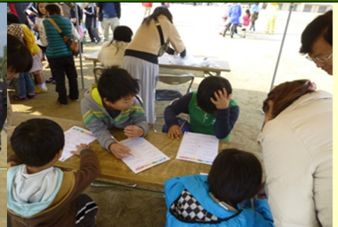
防災クイズに挑戦