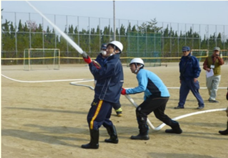
太鼓山・谷田自主防災会の放水