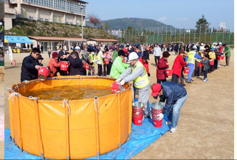
もしもの時のバケツリレー訓練