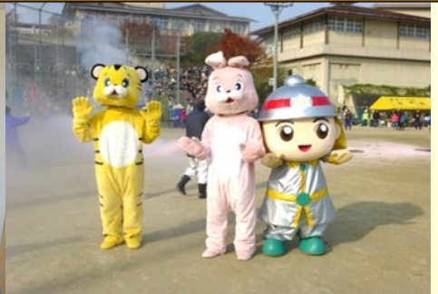
乙訓消防のマスコット「こころくん」