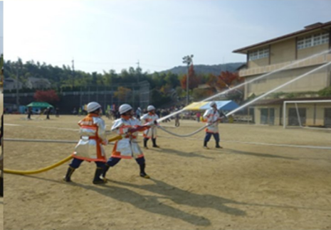
消防団第3分団の放水