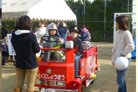
ミニ消防車と写真コーナー