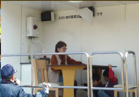
起震車で大きな揺れを体験