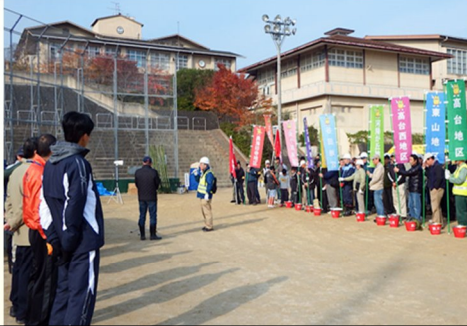
各地区から避難者数の報告

た。炊き出し訓練では「ぜんざい」を、防災フェスタでは起震車体験やミニ消防車と写真コーナーもあり、乙訓消防のマスコットぬいぐるみ「こころくん」の参加もありました。これからも「いざ」というときのために、防災減災意識の高揚と地域コミュニティの活性化を図っていきます。